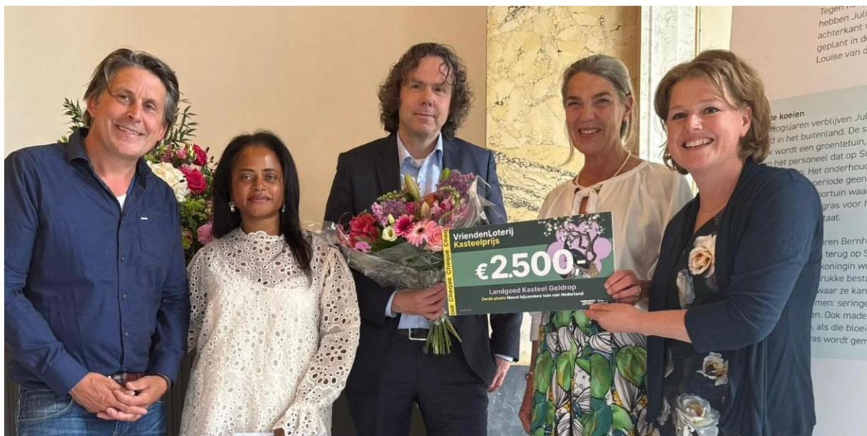
3 e prijs 'De meest bijzondere tuin van Nederland'