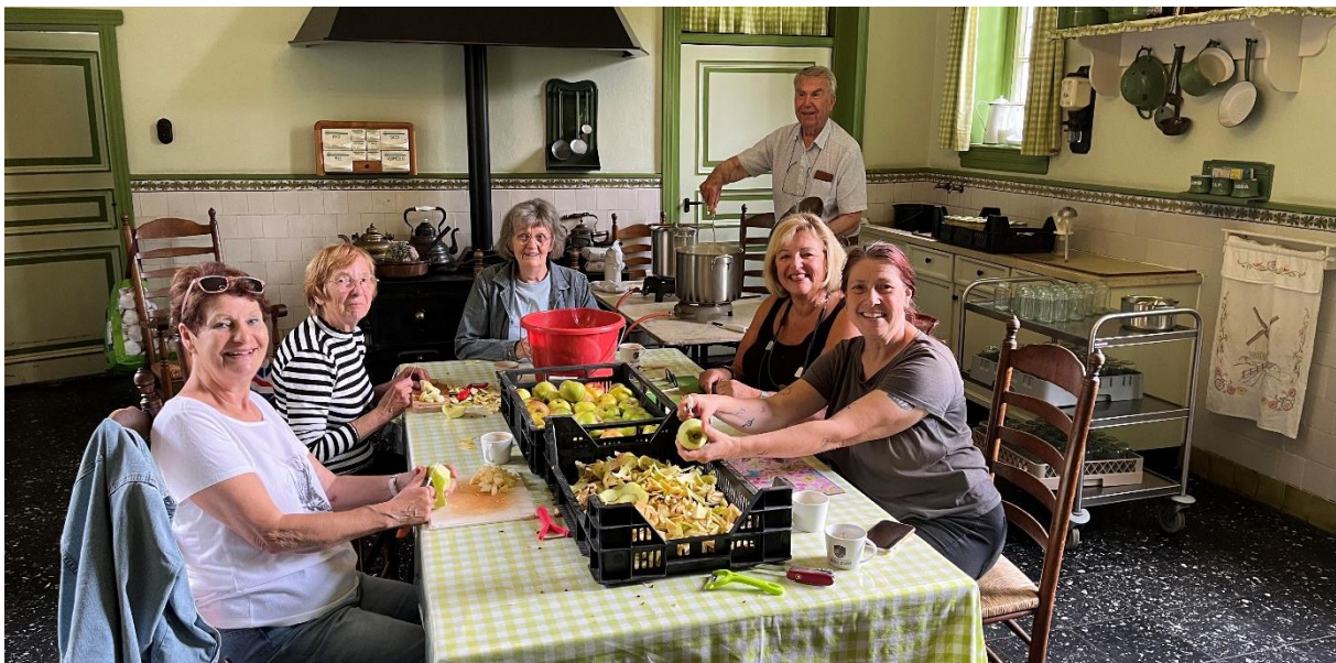
Foto: Commissie appelmoes maakt van de appels uit de hof appelmoes voor het kerstpakket

In het kader van 'Verweven' is er dit jaar ook een samenwerking geweest met de Vrienden van het Weverijmuseum in Geldrop. Wij hebben de Vrienden van het Weverijmuseum op het kasteel ontvangen voor een rondleiding en de Vrienden van het landgoed zijn in het Weverijmuseum te gast geweest. Een prettige samenwerking die met gesloten beurs werd uitgevoerd en die zeker ook mogelijkheden biedt voor de toekomst.