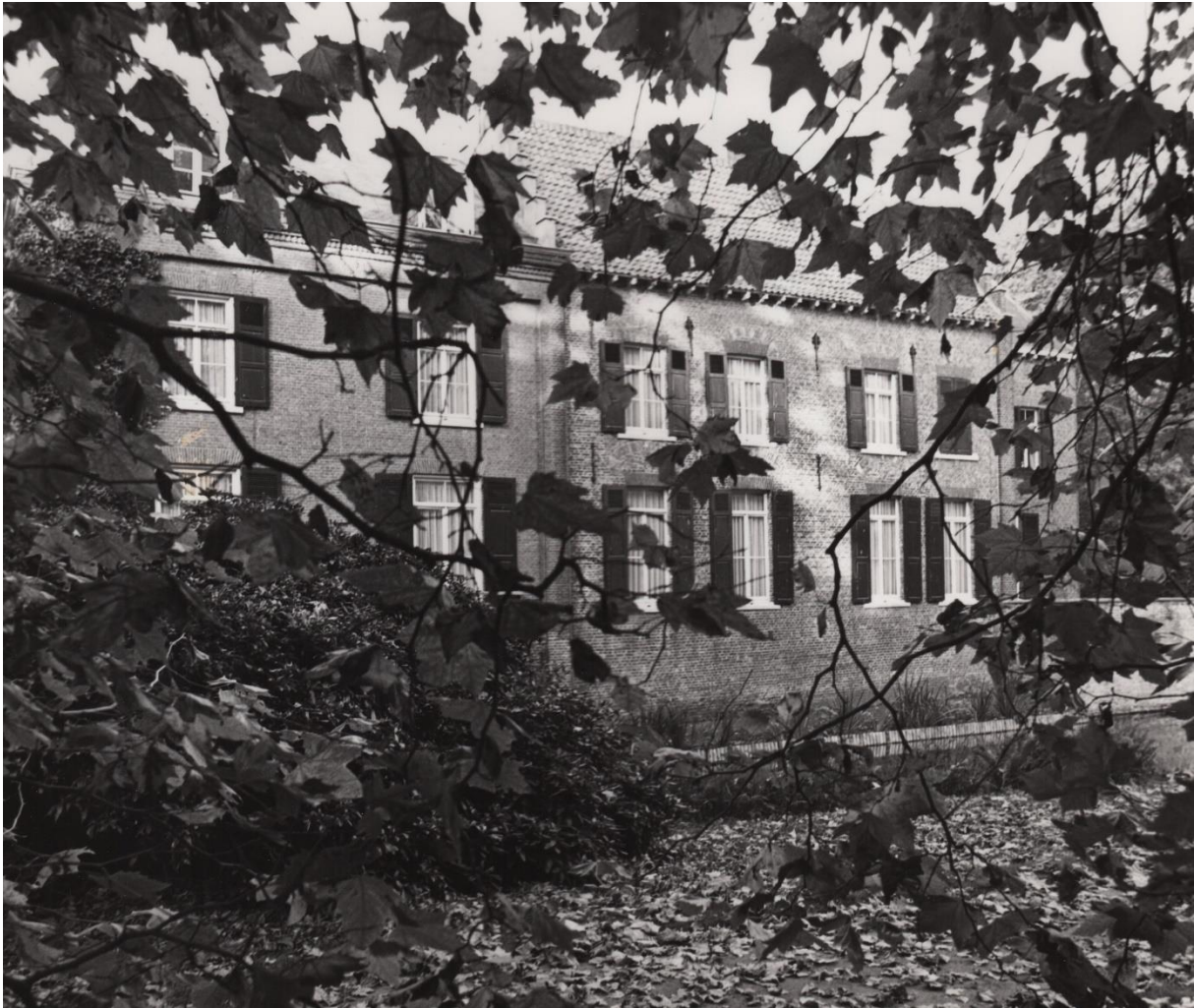
Foto: kasteel jaren '70

Het kasteel is de voormalige woonstee van de familie Van Tuyll van Serooskerken. In 1974 is de gemeente Geldrop eigenaar van het landgoed geworden. Na grondige restauratie en verbouwing wordt het in 1977 door de gemeente opengesteld. In de overdrachtsaktes van het domein naar de gemeente en later van de gemeente naar Stichting Kasteel Geldrop, is vastgelegd dat het in 19-eeuwse stijl ingerichte kasteel toegankelijk gesteld moet worden voor het publiek.