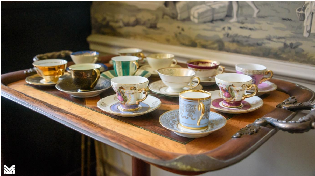
Foto: Mokka kopjes uit de Panoramakamer

Wij zien er naar uit dat ook in de komende periode te doen met als leidraad 'Verjongen, Vernieuwen, Verduurzamen, Verweven en Verrassen'.