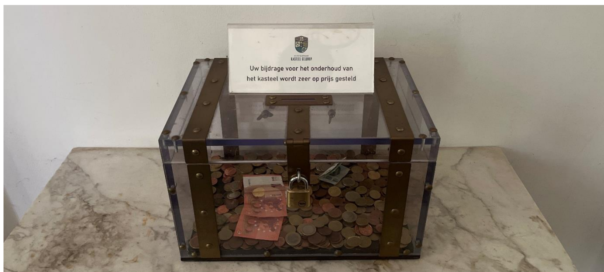
Donatiebus in de hal van het kasteel

Begin 2026 zal een warmtepomp worden geïnstalleerd in de Kasteelhoeve. Tevens zal deze warmtepomp voor verkoeling in de hete zomermaanden kunnen zorgen (op verzoek van de gebruikers van de Kasteelhoeve).