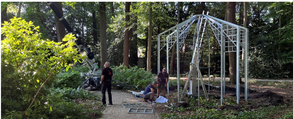
Foto: bouw prieel in juni 2025