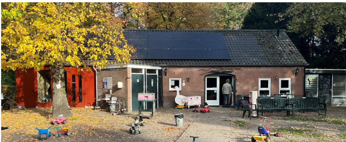
Foto: Kasteel Kinderboerderij met zonnepanelen

De Kasteel Kinderboerderij biedt aan mensen die (tijdelijk) niet kunnen deelnemen aan het reguliere arbeidsproces een goede daginvulling en daarmee structuur. De gemeente stelt voor de begeleiding van hen financiële middelen ter beschikking. Er zijn vrijwilligers die het plezierig vinden om naast een betaalde baan een dagdeel te werken op de kinderboerderij.