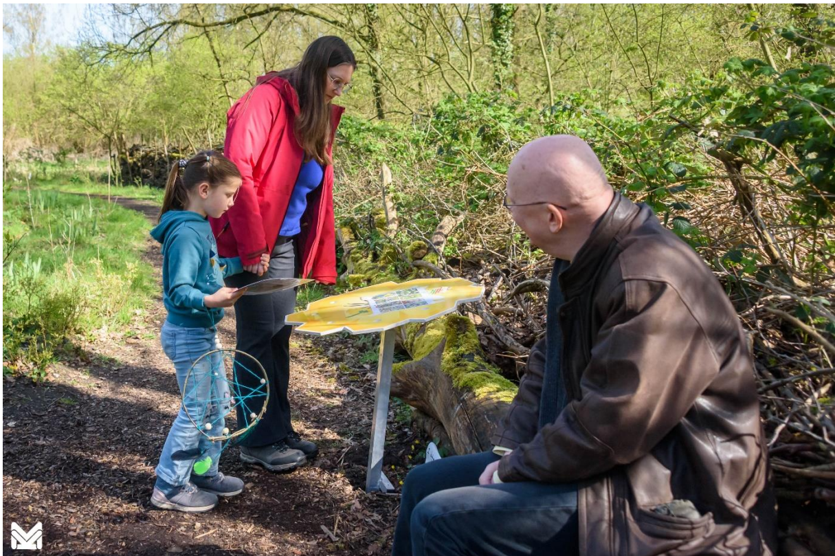
Foto: Voedselbos met informatieve panelen tijdens de Landgoeddag

Het Voedselbos op Landgoed Kasteel Geldrop is geopend op maandag t/m zondag van 9.00 uur tot zonsondergang.