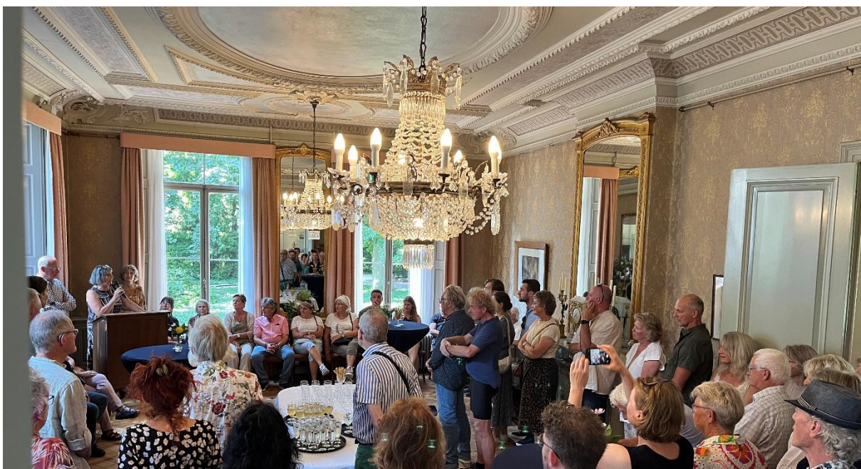
Foto: opening de 80-jarige vrede september 2024

Heerenlandenevents organiseert jaarlijks in januari een Brocantemarkt in het kasteel, kasteelhoeve en het IVN-gebouw.