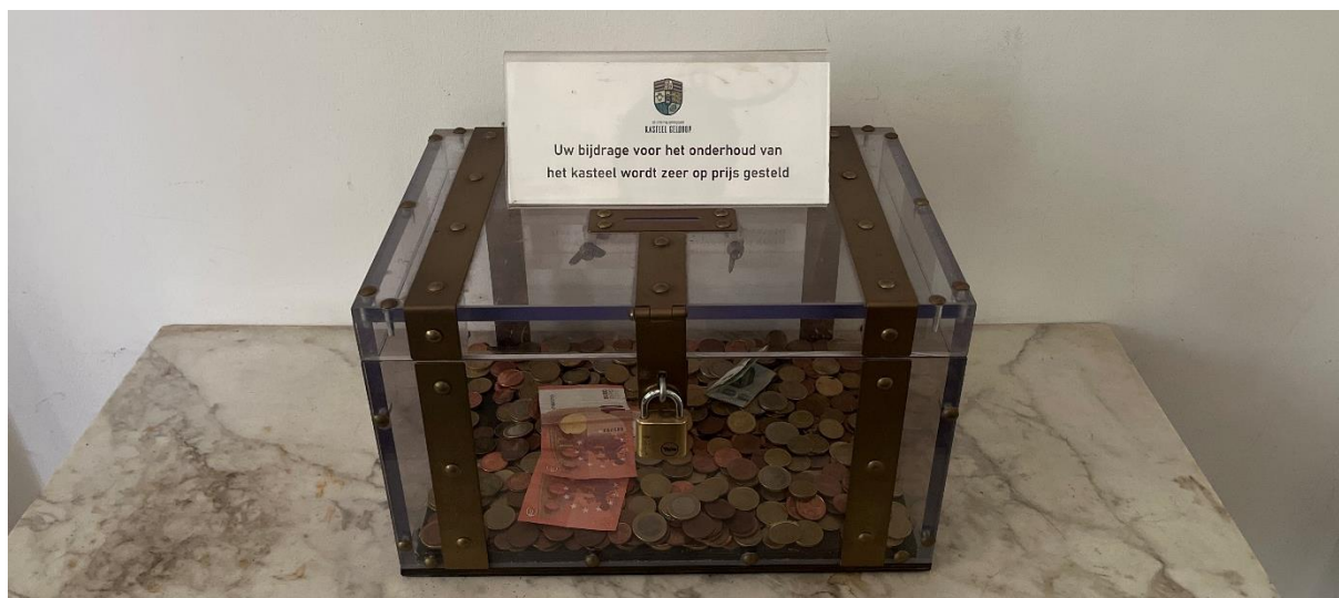
Donatiebus in de hal van het kasteel

Voor gedetailleerde informatie over de Vrienden van Landgoed Kasteel Geldrop zie bijlage 4.