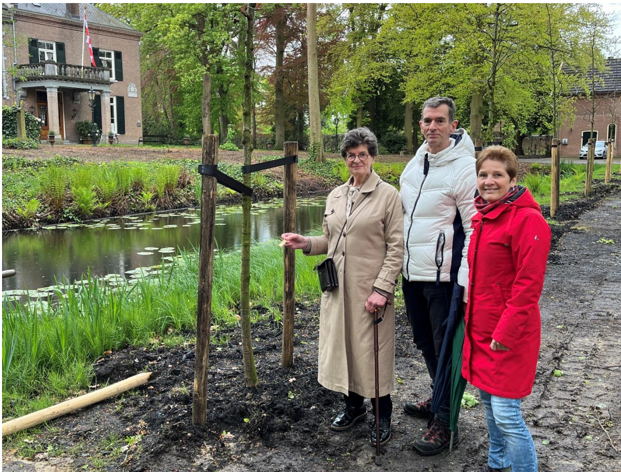
Foto: 130 bomen zijn in 2024 geplant i.s.m. Vrienden van Landgoed Kasteel Geldrop