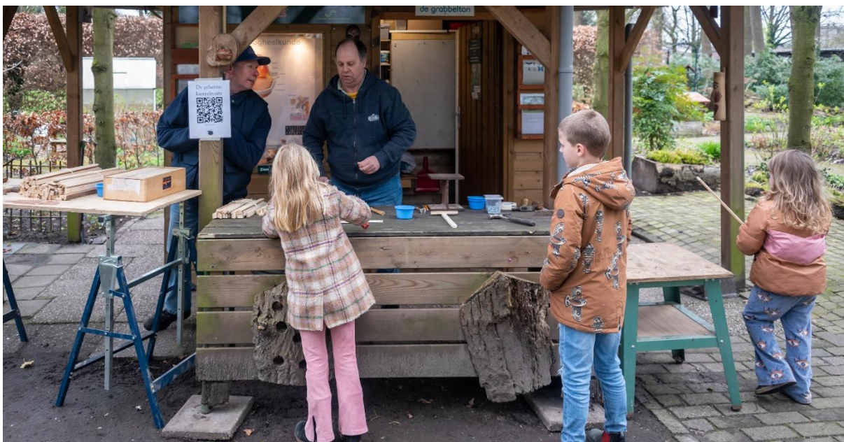
Foto: zwaardenmaken in de Zintuigentuin tijdens de Landgoedddag op 1 april 2024

Kasteel Zintuigentuin werkt nauw samen met de Kinderboerderij. Het doel is natuureducatie voor jong en oud en extra aandacht voor jeugdige bezoekers en mensen met beperkingen, waaronder rolstoelers. De Kinderboerderij heeft veel speelactiviteiten voor de kinderen en laat bezoekers kennis maken met de dierlijke zintuigen. De Zintuigentuin concentreert zich op de menselijke zintuigen.