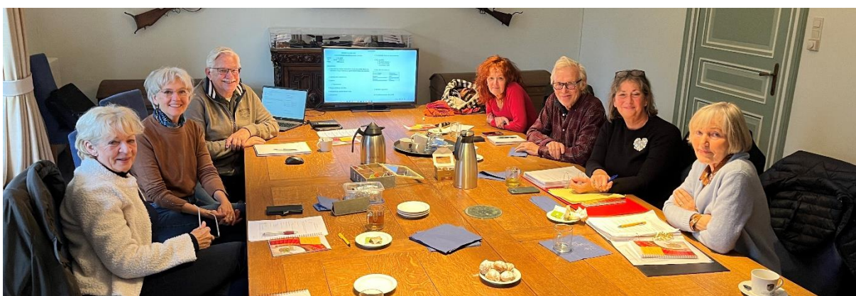
Foto: de Kunstcommissie in vergadering

Wij zien er naar uit dat ook in de komende periode te doen met als leidraad 'Verjongen, Vernieuwen, Verduurzamen en Verweven' en we hopen u te blijven Verrassen!