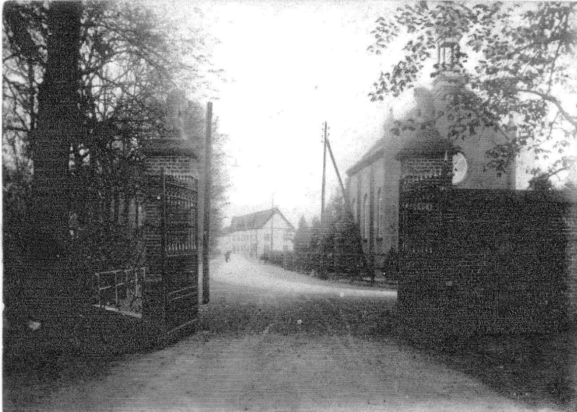
Foto: oude poort Mierloseweg

Het kasteel is de voormalige woonstee van de familie Van Tuyll van Serooskerken. In 1974 is de gemeente Geldrop eigenaar van het landgoed geworden. Na grondige restauratie en verbouwing wordt het in 1977 door de gemeente opengesteld. In de overdrachtsaktes van het domein naar de gemeente en later van de gemeente naar Stichting Kasteel Geldrop, is vastgelegd dat het in 19-eeuwse stijl ingerichte kasteel toegankelijk gesteld moet worden voor het publiek.