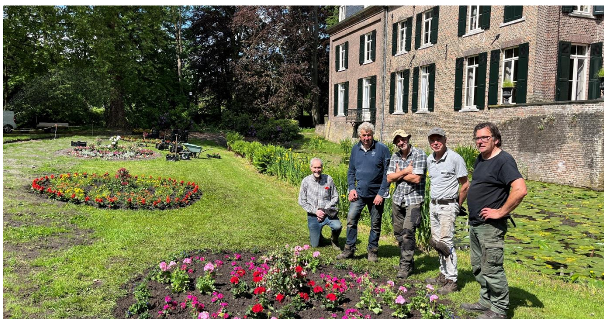
Foto: aanleg borders door vrijwilligers en tuinbaas mei 2024