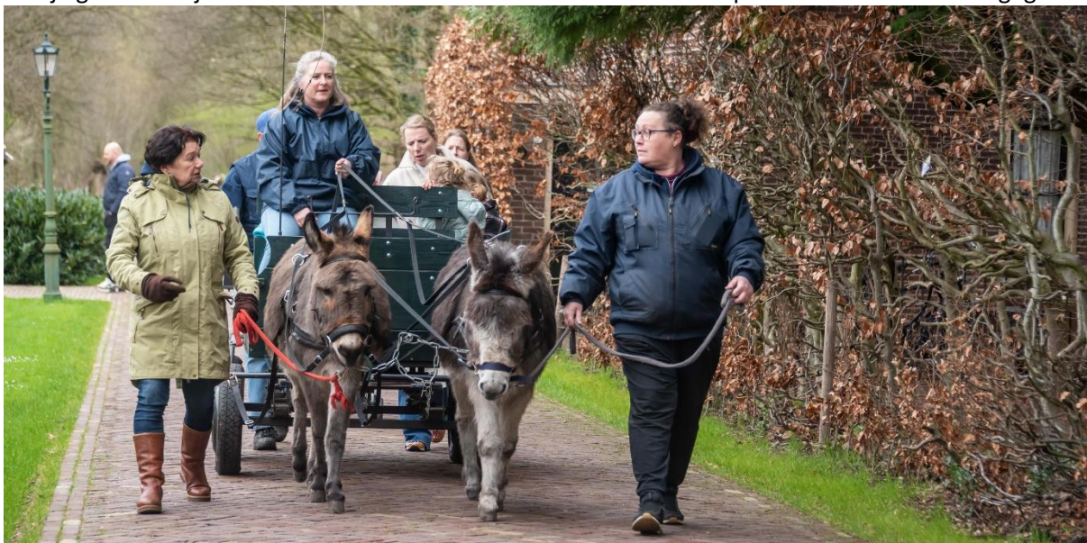
Foto: elke maand ezeltjes voor kinderen

In bijlage 5 is de lijst van activiteiten en bezoekersaantallen over de periode 2018-2024 weergegeven.