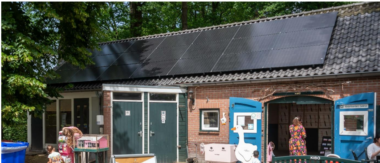
Foto: zonnepanelen op de kinderboerderij, aangebracht in augustus 2024