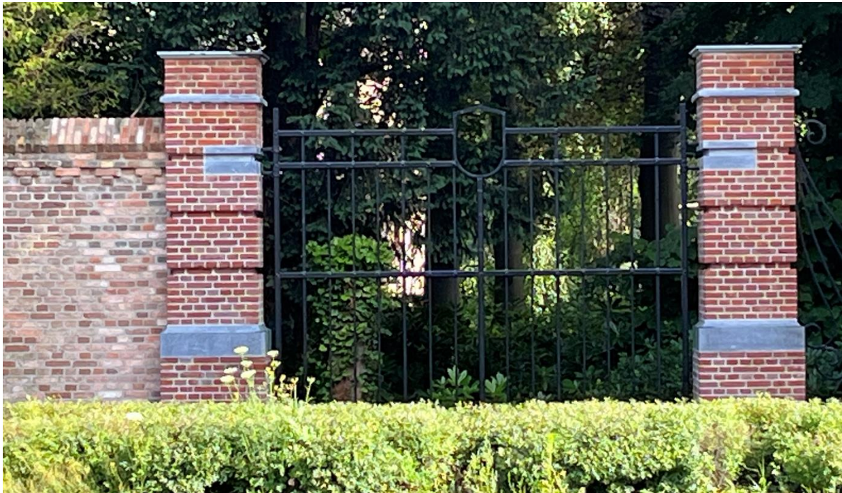
Foto: nieuwe "poort" Mierloseweg, replica van de oude poort, "geopend" in 2024

De stichting verkrijgt haar gelden door commerciële verhuur van ruimtes en het vergaren van subsidies, donaties en vrijwillige bijdragen zoals van de Vrienden van Landgoed Kasteel Geldrop. Ook stelt zij ruimtes beschikbaar voor cultureel-maatschappelijke en educatieve doeleinden tegen een sterk gereduceerd (huur)tarief.