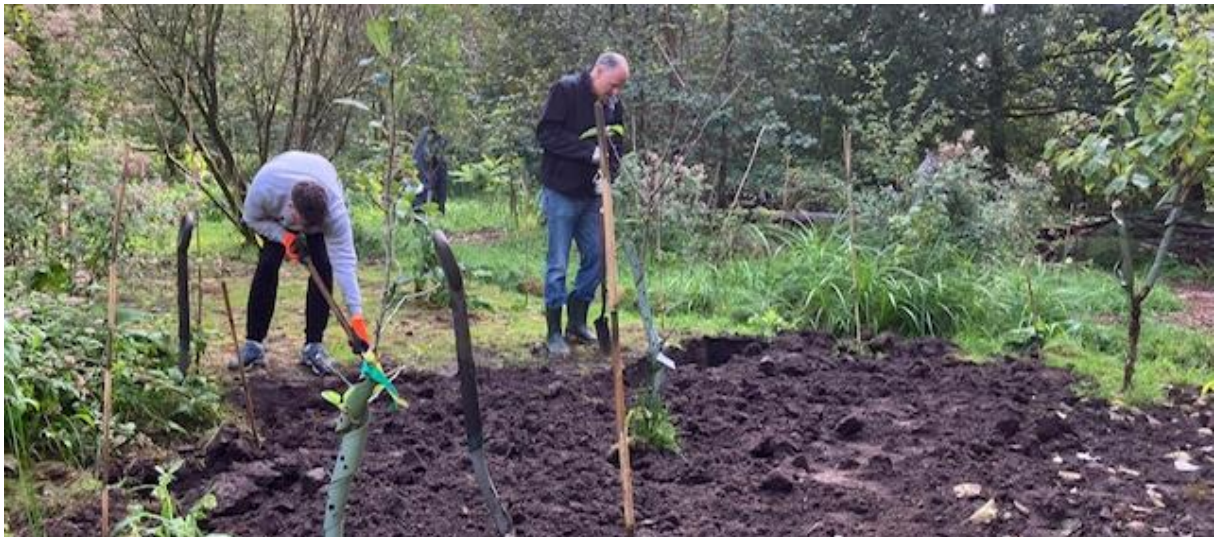
Foto: Voedselbosvrijwilligers aan het werk

Het Voedselbos op Landgoed Kasteel Geldrop is geopend op maandag t/m zondag van 9.00 uur tot zonsondergang.