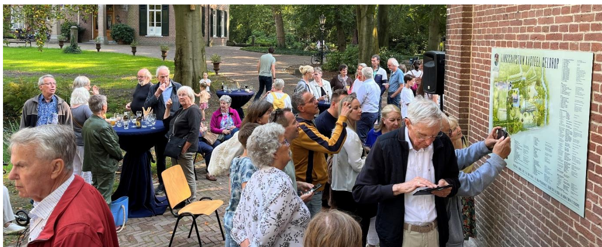
Foto: onthulling bord boomdonateurs van Vrienden van Landgoed Kasteel Geldrop

De lijst met activiteiten en kortingsacties voor Vrienden is opgenomen in bijlage 4.